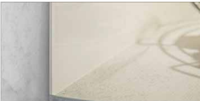
Abb. zeigt MULTISTAR® VISION PLUS in der Nischenanwendung

Die kratzbeständig-beschichtete PMMA-Oberfläche des Glaslaminats wird durch eine spezielle PE-Folie geschützt, die erst nach der Montage entfernt werden darf .