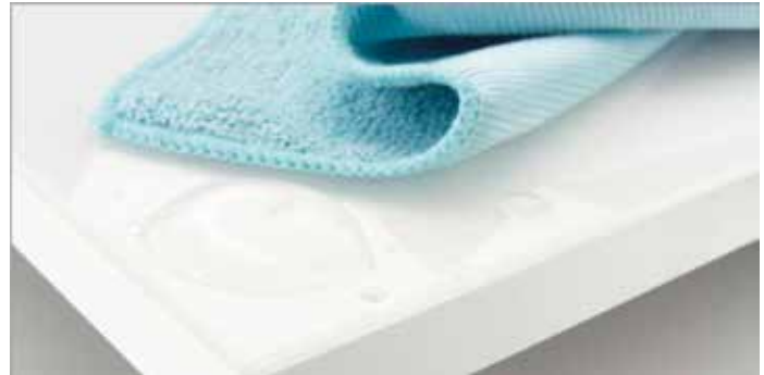
Reinigungsfreundlichkeit MULTISTAR® VISION PLUS

MULTISTAR® VISION PLUS ist reinigungsfreundlich – Die meisten Verschmutzungen sowie Fingerabdrücke können mit Wasser und Mikrofasertuch entfernt werden. Darüber hinaus sind zur Reinigung der Oberfläche haushaltsübliche, flüssige Reiniger verwendbar.