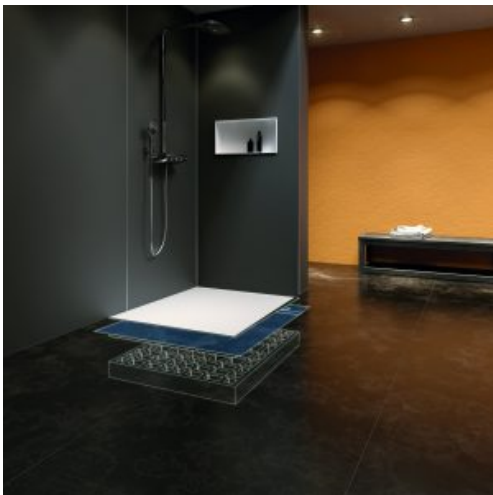
Abbildung zeigt Wände aus Glaslaminat SABBIA matt und PLAN PLUS QUADRATO in Mineralwerkstoff, BIANCO WEISS. Die Nische der SCHEDEL Modulwand ist mit der SCHEDEL PLUSbox in BIANCO WEISS ausgestattet.