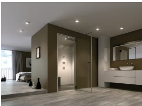
Eine Dampfkabine kann man auch in ein vorhandenes Badezimmer nachrüsten.